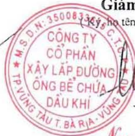
Nguyễn Minh Châu